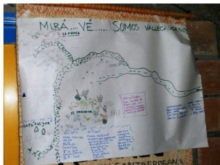
Aspraec- Santa Rosa de Tapias(Guacari)