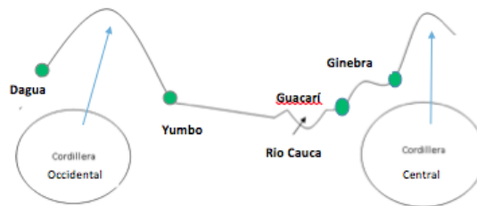
Figura 3. Ecosistemas estratégicos de la zona de estudio