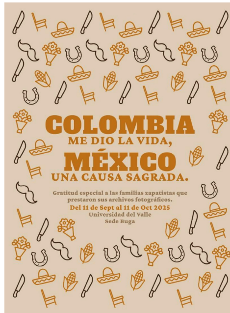
Figura 4. Afiche de la Exposición “Colombia me dio la vida, México una causa sagrada”

Ganarme su confianza no siempre fue fácil, muchas veces me costó meses de trabajo, meses de ir con ellos al campo incluso cuando llovía. Fueron meses que debí pasar siendo muy paciente porque me decían: “si, ven a mi casa” y cuando llegaba no estaban, pero luego cuando logré su confianza, esa confianza se transformó en amistad y esa amistad es para mí mucho más valiosa que incluso los documentos y las fotos.