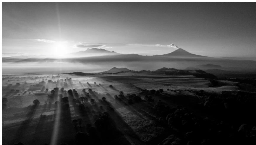
Figura 1. La Tierra Fría de los Volcanes