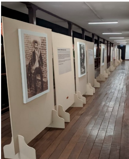
Figura 2. Corredor de las fotografías en la Universidad del Valle, Sede Buga.

MSH: A ver, yo creo que toda fotografía antigua, de por sí, es bella. Mi parámetro para elegir las imágenes de la exposición fue que las personas que allí aparecían hubieran tenido algo que ver con la vida de Julio Cuadros Caldas en la Revolución Mexicana. Me interesaba que cada uno de esos retratos fuera el de alguien que hubiera tenido una relación bonita e interesante con él. Para mí, en tanto historiador, es más el contexto histórico el que avala que yo pueda escoger una determinada foto, mucho más que cuestiones de tipo estético.