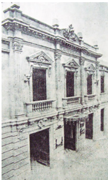
Imagen 2: Fachada del Teatro Bolívar

Fuente: Sábado , mayo 28, 1921, número 4, p. 29.