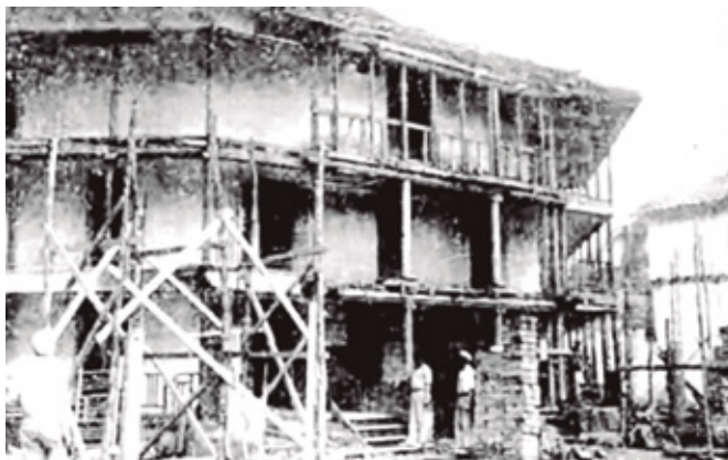
Imagen 4: Teatro Bolívar en proceso de demolición