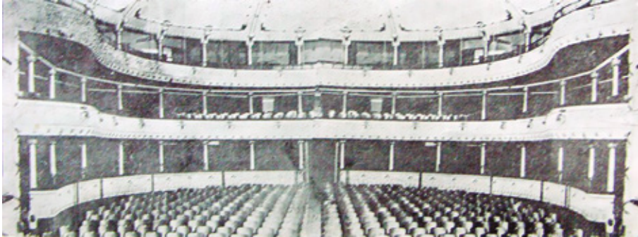
Imagen 3: Interior del Teatro Bolívar