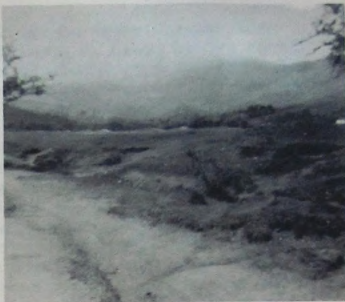
Cuenca del Valle de Cañaveralejo