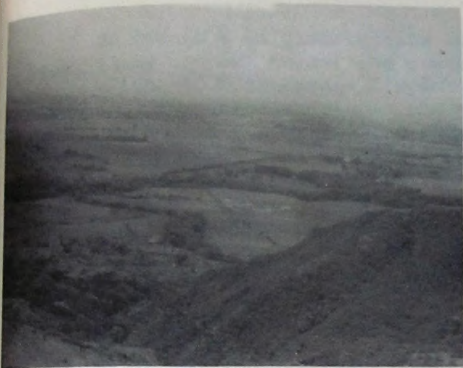
Ciénaga piedmontaña cercana a lome- ríos precordilleranos. Area actual- mente deforestada de la densa vege- tación que la cubría. Municipio de Jamundí.