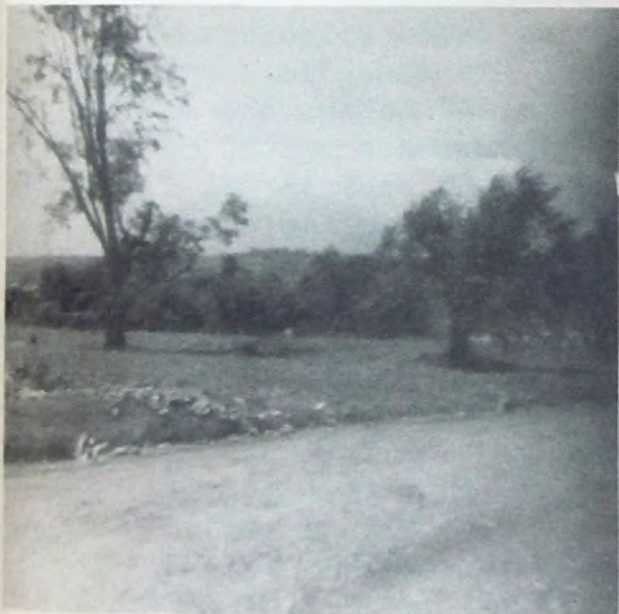
Restos de antigua cubierta de bosque tropical denso, en el piedmonte de Meléndez.