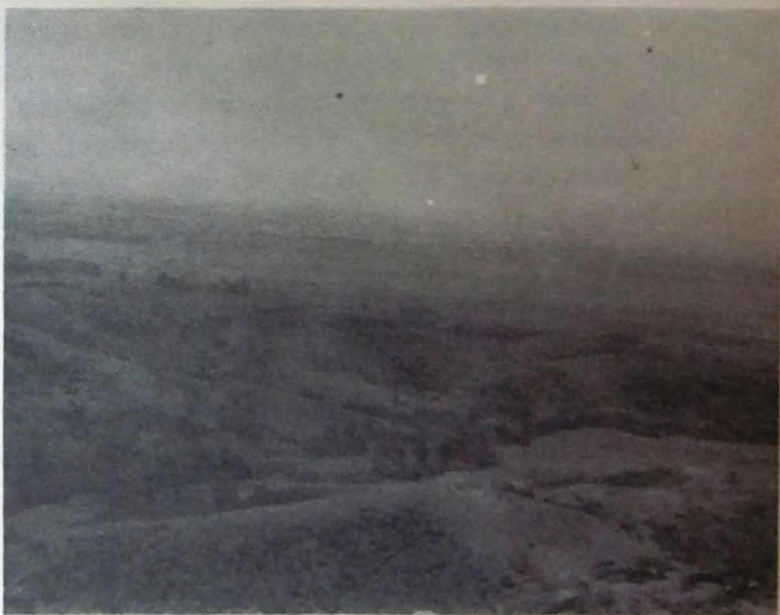
Lomajes y pequeño valle cercano a la ciudad de Jamundí